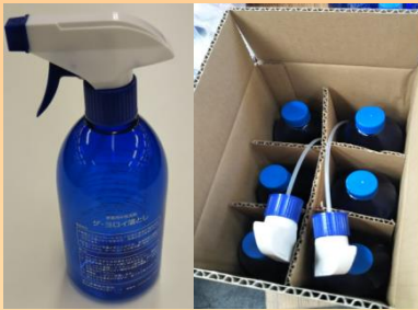
500gスプレーボトル×6本